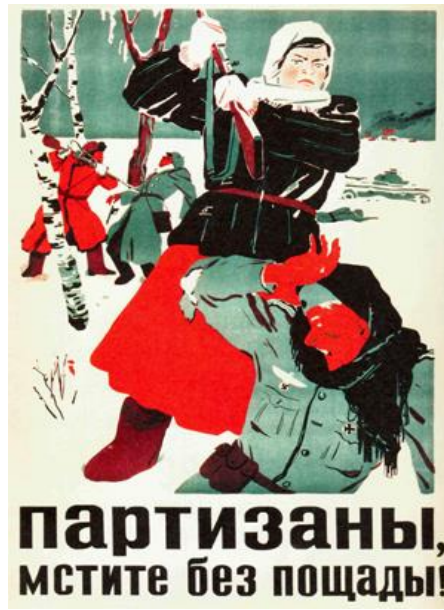
Resim 2: "Kadın Partizan" Konulu Propaganda Posteri

"Kadın Partizan" konulu propaganda posteri gösteren açıdan incelendiğinde, posterde Sovyet sivillerin Alman askerlerine karşı mücadele ettiği görülmektedir. Özellikle posterin merkezinde bir Sovyet kadının Alman askerine karşı mücadelesi aktarılmaktadır. Posterde "Partizanlar, merhametsizce intikam!" şeklinde yazılı kod bulunmaktadır.