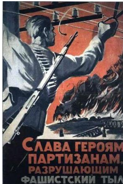
Resim 6: "Sabotajcı" Konulu Propaganda Posterini

"Sabotajcı" konulu propaganda posterini gösteren açıısından incelendiğinde, posterde bir Sovyet sivilin elindeki makas ile kabloları kestiği aktarılmaktadır. Sovyet sivilin kabloları kestiği anda Alman askeri bölgesinden de ateşlerin yükseldiği gösterilmektedir. Posterde "Faşistlerin arka tarafını yok eden partizan kahramanlara zafer!" şeklinde yazılı kod bulunmaktadır.