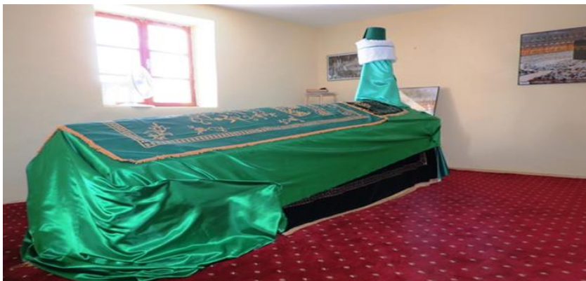
Resim 2. Ömer Baba Sandukası (Cumali Levent, Arapgir, 2012).