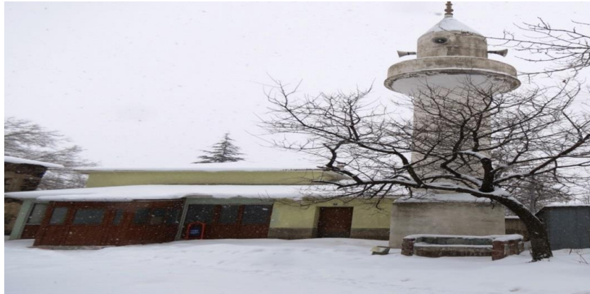
Resim 1. Tekke Camisi.