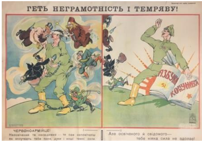
Poster 5. Kızıl Ordu Konulu Poster 5 (Redavantgarde, 2020).