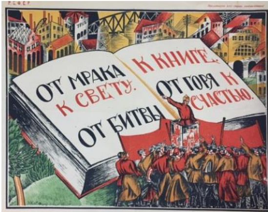
Poster 8. “Mutluluk” Konulu Poster 8 (Redavantgarde, 2020).

Mutluluk konulu poster, 1921 yılında Kogout Nikolay Nikolaevich tarafından hazırlanmaktadır. Duygusal işlev boyutunda incelendiğinde posterde devasa boyutta bir kitap görselinin bulunduğu görülmektedir. Kitabın önünde başında Kızıl Ordu askerinin şapkası bulunan bir kişinin kürsüde olduğu ve çevresinde de kızıl pankartlar taşıyan insanların yer aldığı yansıtılmaktadır. Posterin arka planında da ev görsellerine yer verilmektedir. Posterdeki binaların üzerinde sırasıyla ТРУД (İŞ), ИСКУССТВО (SANAT) ve НАУКА (BİLİM) yazıları bulunmaktadır.