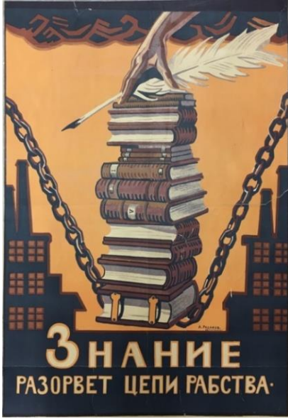
Poster 1. “Köleliğin Zinciri” Konulu Poster 1 (Redavantgarde, 2020).