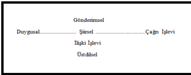
Şekil 2. Jakobson'a Göre Sözlü İletişimin Altı İşlevi (Fiske, 2017, s. 115).

Görseller, propaganda mesajlarının kitlelere aktarılmasında büyük önem taşımaktadır. Nitekim kimi zaman uzun metinler halinde kitlelere verilmek istenen propaganda mesajları, yalnızca tek bir görsel üzerinden yansıtılabilmektedir. Geçmiş dönemlerde okuma yazma bilmeyen insanlara, yazı yoluyla verilemeyen propaganda mesajları görseller üzerinden verilebilmiştir. Diğer yandan yazılı bir metindeki propaganda mesajı, yalnızca o dili bilen kişiler tarafından anlaşılabilirken, görseller üzerinden verilen propaganda mesajı evrensel bir özellik kazanabilmektedir. Görsellerde yer verilen resimlerde insanlar olduğundan daha büyük veya daha küçük sunulabilmekte, bu şekilde kitlelerin dikkatinin belli bir yöne çekilmesi sağlanabilmektedir. Diğer yandan propaganda mesajı, yazıya oranla görseller yoluyla kitlelerin zihinlerinde daha akılda kalıcı olabilmektedir. Göstergebilimde propaganda posterlerinde kullanılan görsel ve yazılı göstergeler bir bütün olarak analiz edilerek, propaganda posterleri üzerinden verilmek istenilen propaganda mesajları ortaya konulmaya çalışılmaktadır.