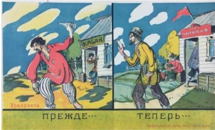
Poster 2. “Geçmiş” Konulu Poster 2 (Redavantgarde, 2020).

Geçmiş konulu poster, 1920 yılında Leonid Viktorovich Sayansky tarafından hazırlanmaktadır. Duygusal işlev boyutunda incelendiğinde posterin sol ve sağ kısım olmak üzere iki farklı bölümden oluştuğu görülmektedir. Posterin sol tarafında elinde şişe bulunan, kıyafeti yırtık bir erkek görseline yer verilmektedir. Kişinin arkasında üzerinde КАБАК (İçki Salonu) yazan bir yapının olduğu görülmektedir. Posterin sağ tarafında ise elinde kitap bulunan bir kişi görseline yer verilmektedir. Kişinin arkasında üzerinde Читальня (Okuma Salonu) yazan bir yapı ve elinde kitap bulunan insanlar bulunmaktadır. Yapının kapısında kırmızı bir bayrak ve Komünizm ideolojisinin simgesi orak ve çekiç görselleri yer almaktadır.