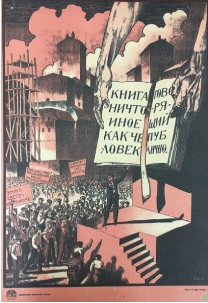
Poster 7. “Konuşan İnsan” Konulu Poster 7 (Redavantgarde, 2020).