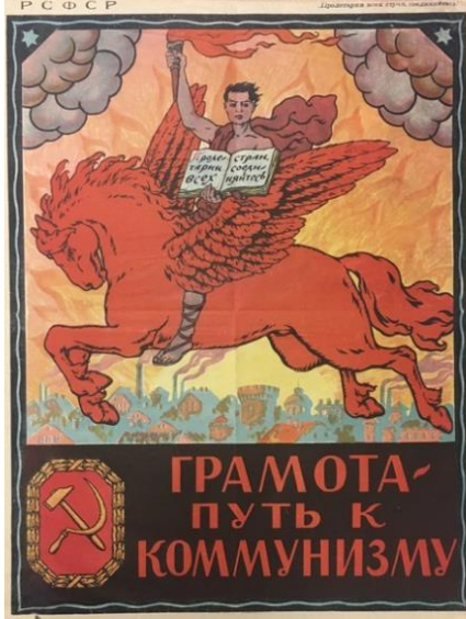
Poster 3. “Komünizm” Konulu Poster 3 (Redavantgarde, 2020).

insan görseline yer verildiği görülmektedir. Kanatlı bir atın üzerindeki insanın bir elinde kitap, diğer elinde ise yanan bir meşale tuttuğu ve eski çağlardan kalma bir kıyafet giydiği resmedilmektedir. Posterin arka planında şehir ve siyah duman görseli bulunmaktadır. Posterdeki yazının solunda da Komünizm ideolojisinin simgesi olarak ve çekiç görseli yer almaktadır.