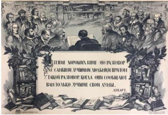
Poster 4. İyi İnsanlar Konulu Poster 4 (Redavantgarde, 2020).

İyi insanlar konulu poster, 1920 yılında Ivan Vasilyevich Simakov tarafından hazırlanmaktadır. Duygusal işlev boyutunda incelendiğinde posterin merkezinde bir insanın kitap okuduğu resmedilmektedir. Posterin altında da bir yazının olduğu görülmektedir. Kitap okuyan insanın çevresinde Lenin, Karl Marx gibi insan görselleri ve kitaplar yer almaktadır.