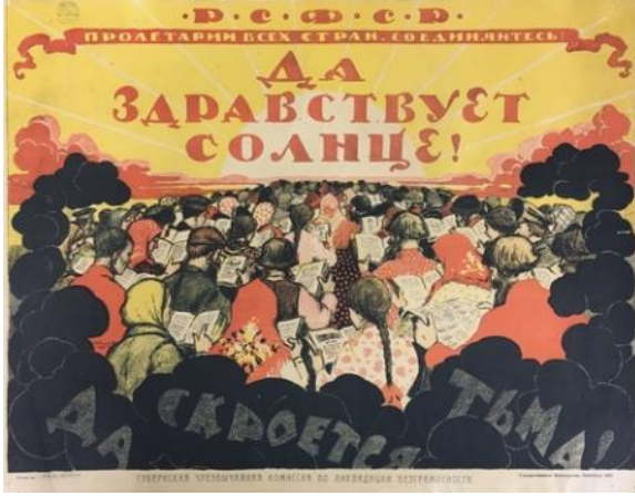
Poster 9. Karanlık Konulu Poster 9 (Redavantgarde, 2020).