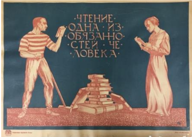
Poster 6. Sorumluluk Konulu Poster 6 (Redavantgarde, 2020).

Sorumluluk konulu poster, 1920 yılında Viktor Semenovich Ivanov tarafından hazırlanmaktadır. Duygusal işlev boyutunda incelendiğinde posterde kitap okumakta olan bir erkek ve bir kadın görseline yer verilmektedir. Posterin merkezinde ise kitapların bulunduğu görülmektedir. Posterde siyah fona yer verilmektedir.