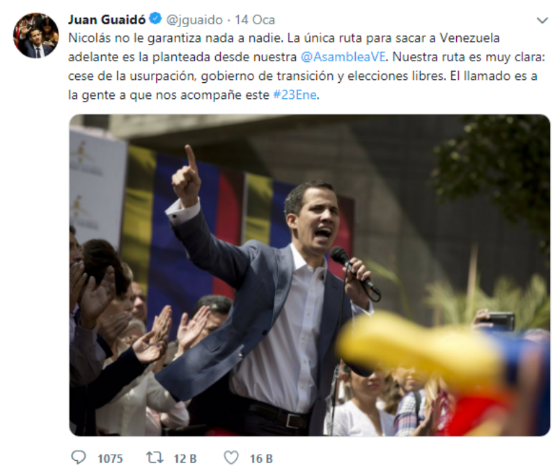
Resim 2. Guaidó'nun 14 Ocak Tarihli Twitter Paylaşımı

Resim 2'de Guaidó'nun direnişi telkin eden "Nicolás kimseye hiçbir şey garanti etmiyor. Venezuela'yı ilerletecek tek yol @AsambleaVE'niz tarafından önerilen rota. Güzergahımız çok açık: gaspın sona ermesi, geçici hükümet ve serbest seçimler. Çağrımız bize eşlik edecek insanlara" şeklinde İspanyolca tweeti yer almaktadır. Coşku çekiciliği içeren mesajlarda Guaidó bu üç talep üzerinden mesajını anlaşılır ve basit bir şekilde kitlelere kabul ettirmeye çalışmaktadır.